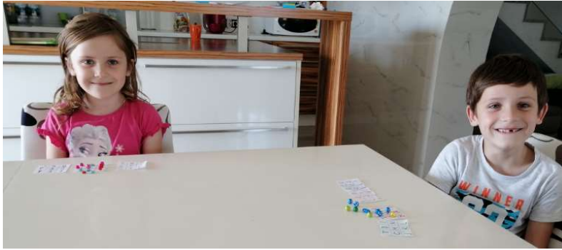
KLARA IN NEJC SE UČITA TUDI Z DIDAKTIČNIMI IGRAMI.