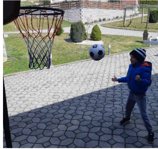
BO TIM NOVI LUKA DONČIĆ?