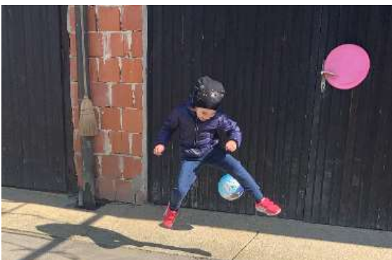
VIVA SE ZABAVA Z ŽOGO.