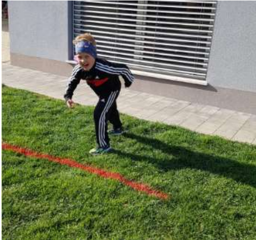
ROK TRENIRA VISOKI ŠTART.