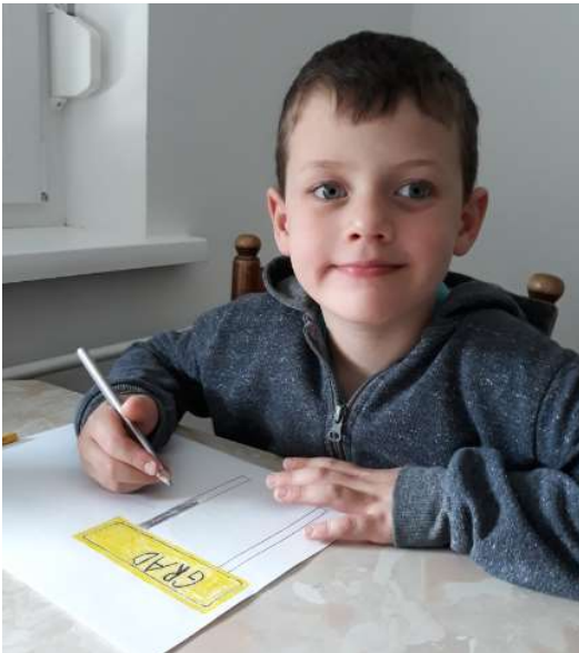
TIMI IMA ŠE VEDNO RAD PROMETNE ZNAKE.