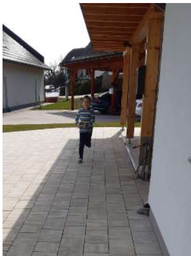
JAN SKRBI ZA DOBRO KONDICIJO.