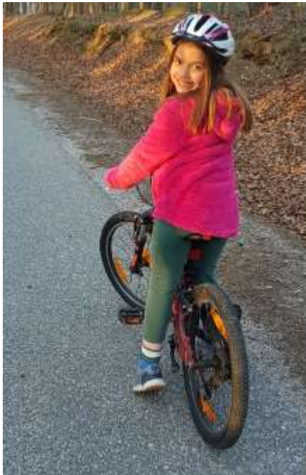
LINA SE JE NA POTEK ODPRVILA S KOLESOM.