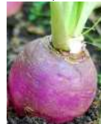
die weiße Rübe